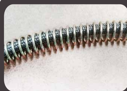
Detalle pigtail flexible

● Air Méd ● N2O ● N2 ● Ar ● He ● CO2 ● O2*